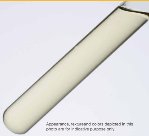
Appearance, texture and colors depicted in this photo are for indicative purpose only